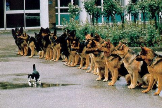
從容以赴 處變不驚

曾經有人說過：「基督徒的信心是需要藉著危難鍛練出來的。」在危難裡，我們學習全心全意的依靠神，不再靠人的智慧和能力。就像使徒保羅在哥林多後書十二章九節所說的『祂對我說：我的恩典夠你用的，因為我的能力是在人的軟弱上顯得完全。』